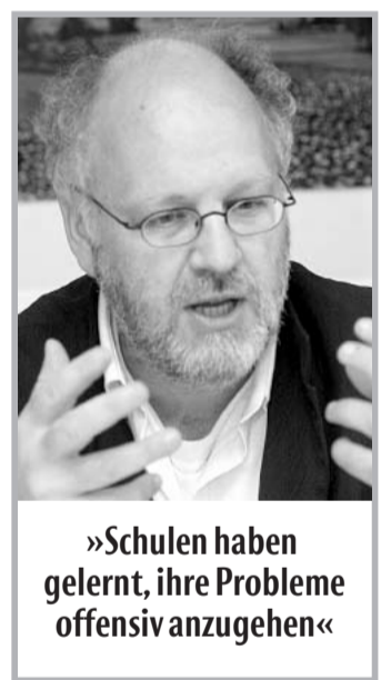
»Schulen haben gelernt, ihre Probleme offensiv anzugehen«

NIEKAMP: Die Zahl der Spielabbrüche ist um etwa 50 Prozent gesunken. Aber Gewalt auf dem Spielfeld ist nicht das einzige Problem, das zeigt der Fall des misshandelten Jugendfußballers, der