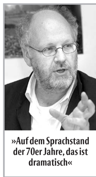
»Auf dem Sprachstand der 70er Jahre, das ist dramatisch«

Gewisse Traditionen? NIEKAMP: Eine Auseinandersetzung mit einem türkischen Vater hat mich sehr beeindruckt. Er wollte, dass sein Sohn erst Arabisch lernt und dann fleißig den Koran studiert. „Und wann kommt Deutsch? Ihr Sohn lebt in Deutschland“, habe ich den Mann gefragt. Er meinte, einen Job finde sein Sohn überall, er selbst sei ja auch bei einer Eisengießerei untergekommen. Was hat dieser Junge für eine