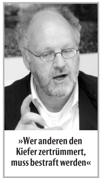
»Wer anderen den Kiefer zertrümmert, muss bestraft werden«

NIEKAMP: Früher haben Schulen ablehnend reagiert nach dem Motto ‚Gewalt gibt es bei uns nicht, Drogen auch nicht‘. Mittlerweile haben sie gelernt, dass jede Schule betroffen ist, und gehen offensiv damit um. Einige Schulen machen seit Jahren Gewaltprävention. Wir unterstützen das. Je eher sich eine Schule solcher Probleme annimmt, desto eher profitiert sie. Manchmal werden allerdings Probleme an uns herangetragen, die sich mit sozialpolitischen Konzepten nicht lösen lassen. Mit dem Immobilien-Service-Betrieb haben wir uns fünf Schulen mit Vandalismusschäden angeschaut. An allen Schulen