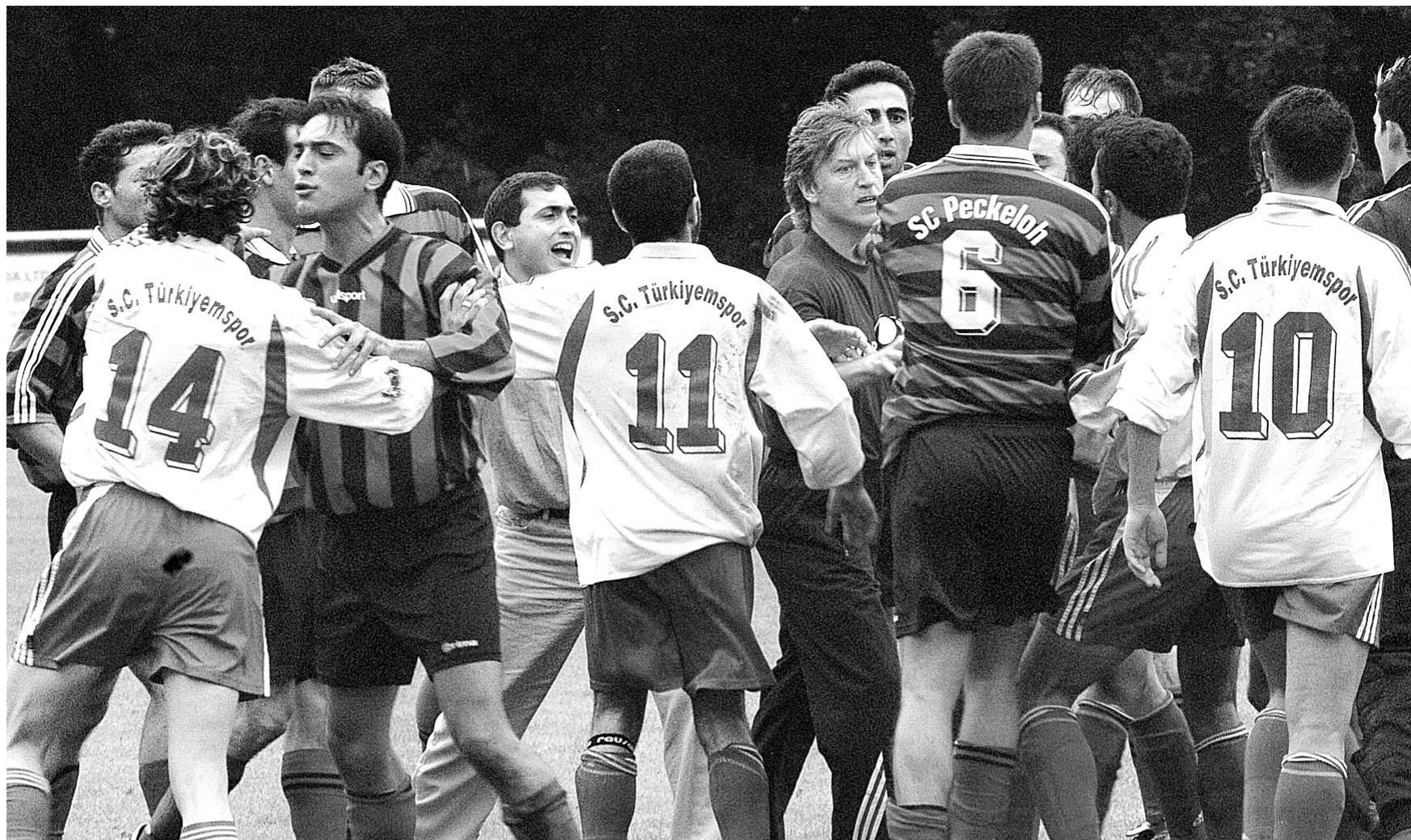
„Zahl der Spielabbrüche um 50 Prozent gesunken“: Gewaltprävention bestimmt die Arbeit des SKPR – auch auf dem Fußballplatz.